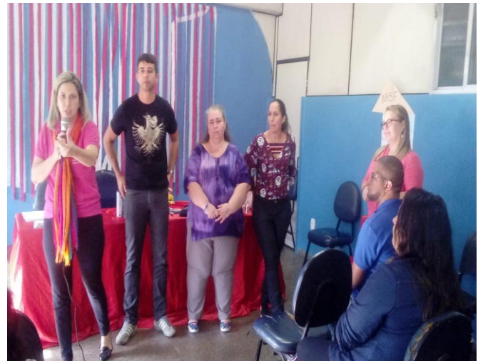
Encerramento das Oficinas de Acolhimento com as Equipes NASF