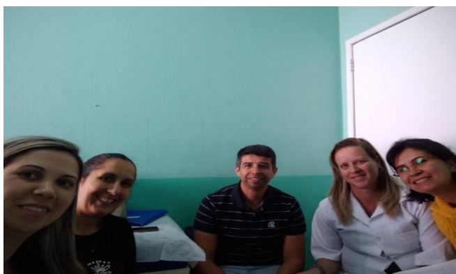
Reunião na ESF Jd Nova Era para confeção dos PTS(projeto terapeutico singular) pertinentes ao território