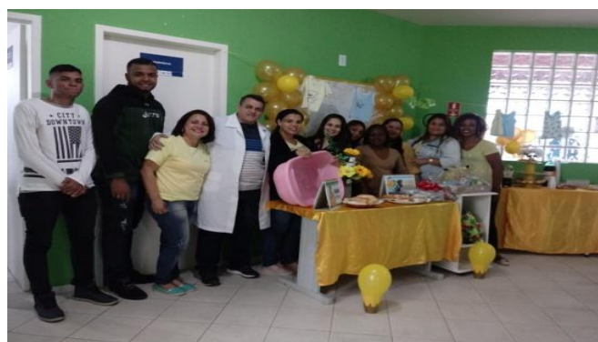
Evento Aleitamento Materno (27.08.2018)