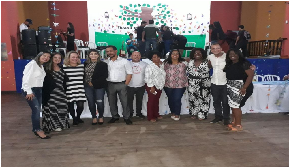
Evento Junto à Secretaria do Idoso (Prevenção contra violência ao Idoso)