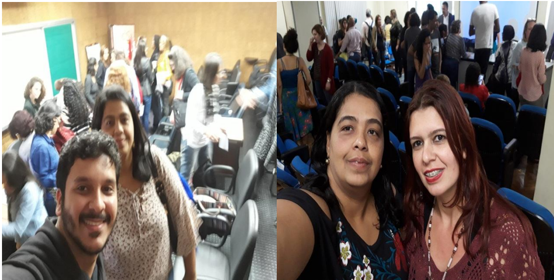
Educação continuada para equipe (curso de capacitação Libras)