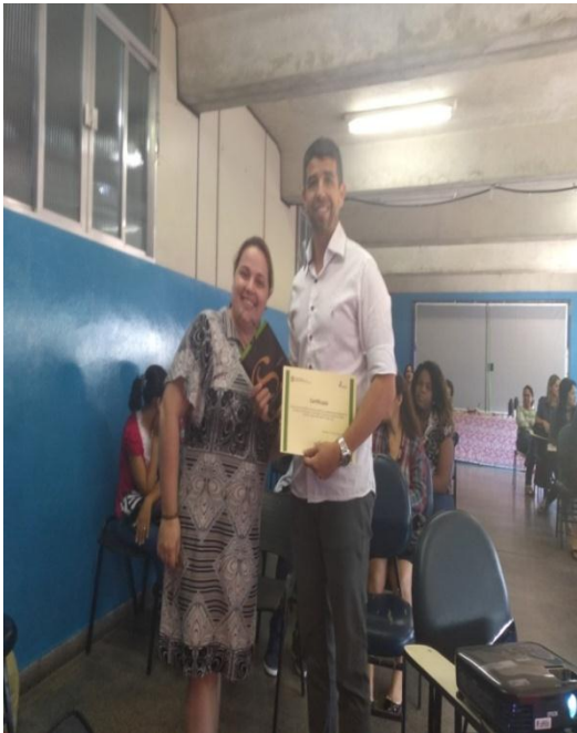
Oficina com Profissionais da Educação sobre Primeiros Socorros realizado pelo Educador Físico do NASF.