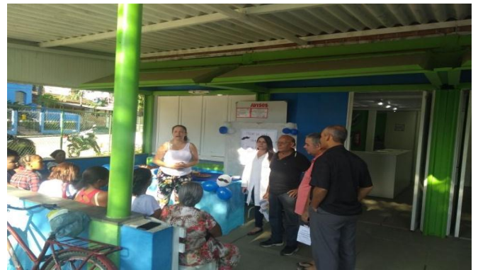
Palestra sobre Hipertensão (17.05.2018)