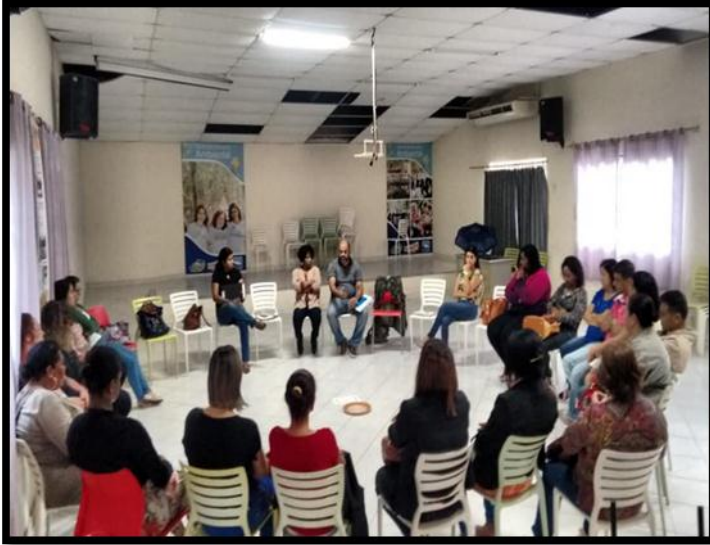
Atividade em PICS (Práticas Integrativas e Complementares em Saúde) : Roda de Terapia Comunitária Integrativa