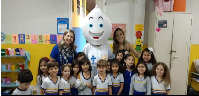
PSE Alimentação Saudável na Creche Darielle