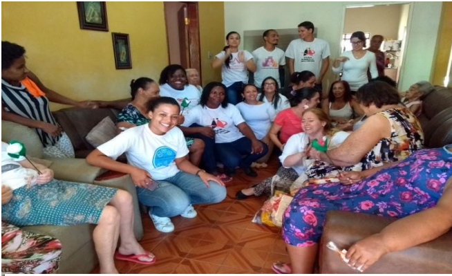
Sensibilização sobre a GRIPE com Parceria do CRAS Foi exposto para as cuidadoras e para as idosas da casa terapêutica a necessidade da imunização contra a