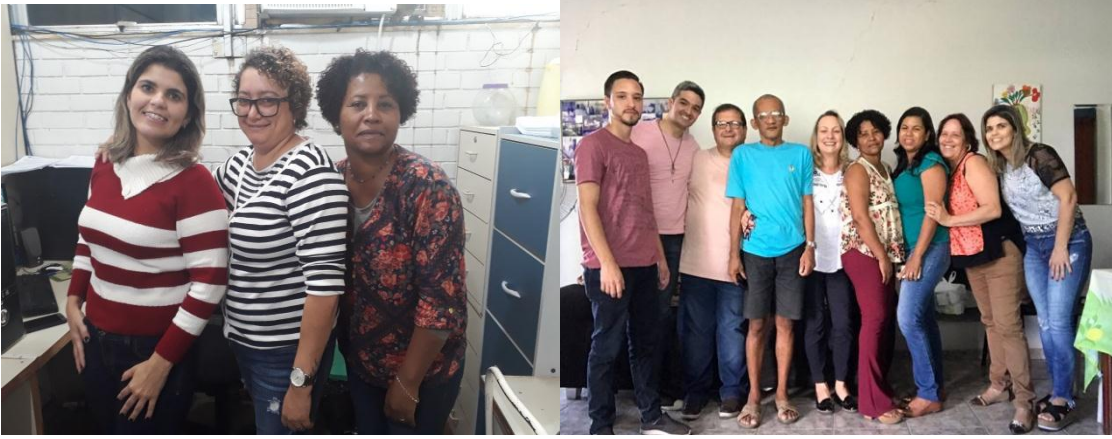
Reunião saúde do trabalhador e Reunião com Atenção Básica e PSE