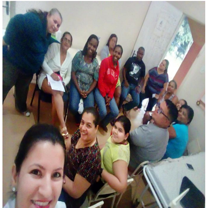
Grupos de Alimentação Saudável e Caminhada Feliz com a Equipe NASF