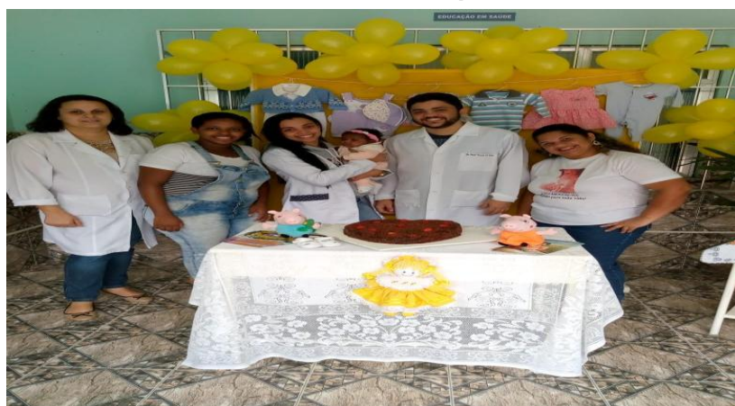
Evento Aleitamento Materno (29.08.2018)