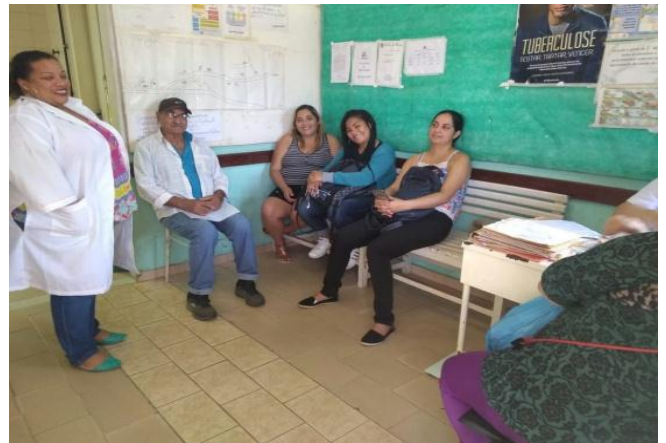
Palestra sobre DST (05.07.2018)