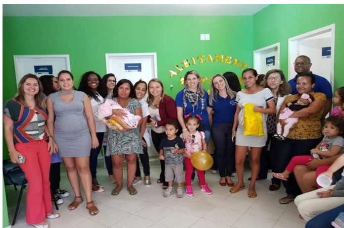
Evento Aleitamento Materno (30.08.2018)