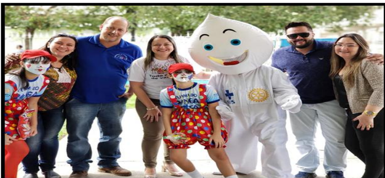
Zé Gotinha na Campanha de Vacinação da Poliomielite e o Sarampo