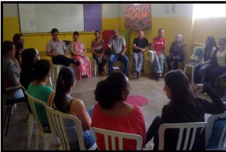
Oficina de Educação popular em Saúde/ EdPopSUS