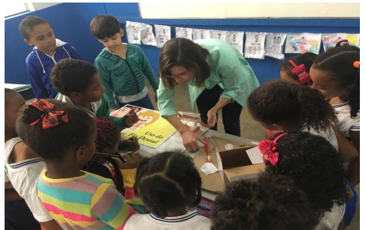
PSE na Escola Margarida Alves – Tema: Saúde Bucal