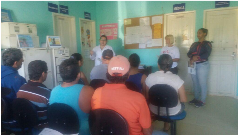
Palestra sobre Tuberculose (16.07.2018)