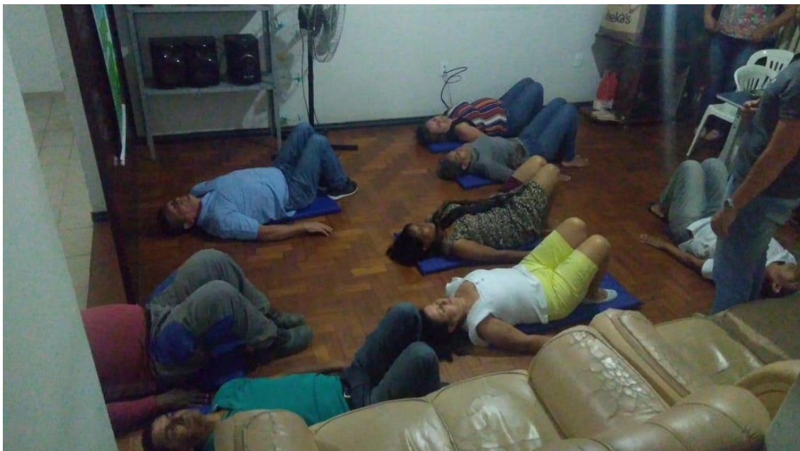
Incentivo à Cultura – Participação no Evento Villa Lobos