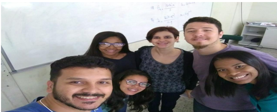
Participação no evento - Epidemiologia combate ao tabaco