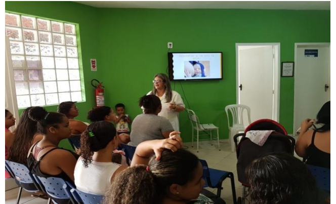
Evento Aleitamento Materno (22.08.2018)