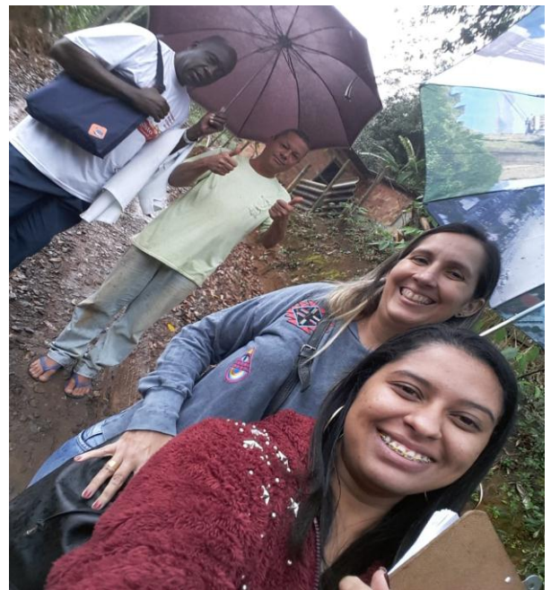
Visitas Domiciliares da Equipe NASF (fisioterapeuta)