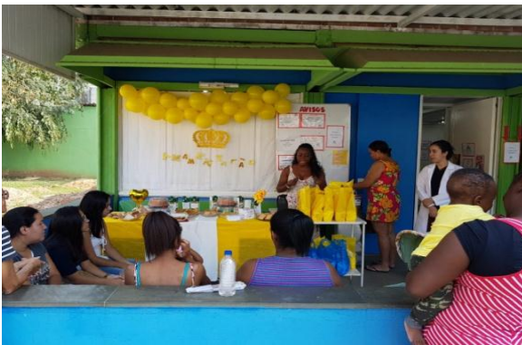
Evento Aleitamento Materno (22.08.2018)