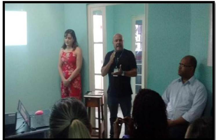
Educação permanente em: Atualização em curativo para profissionais da enfermagem do HMAG