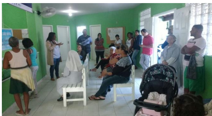
Palestra Saúde Mental (21.05.2018)