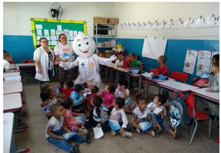
Participação do Zé Gotinha na escola (14.08.2018)