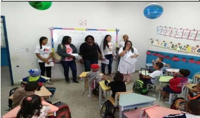
PSE Alimentação Saudável na Creche Darielle