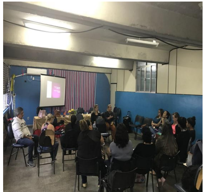
Oficina com as enfermeiras da Rede Básica sobre Planejamento das Ações