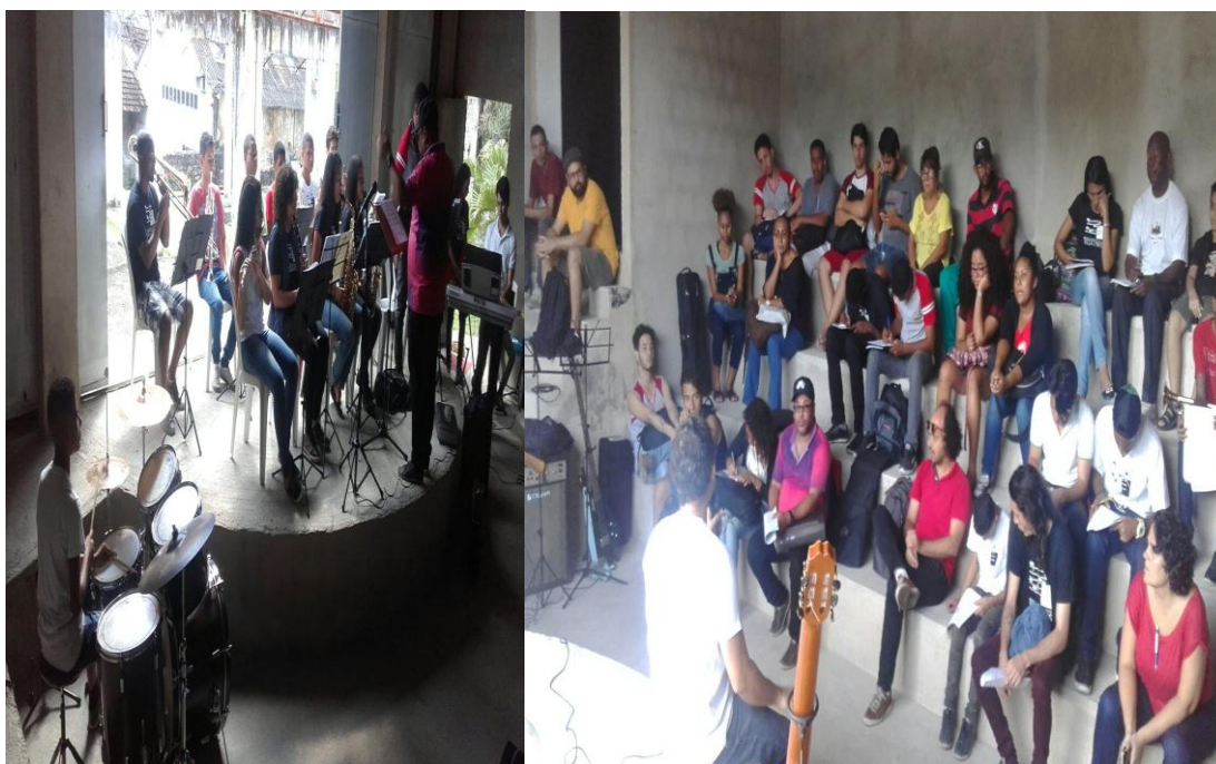
Educação continuada (Fóruns, seminários, palestras )