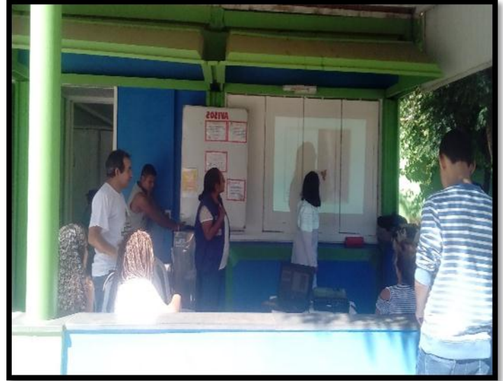
Palestra Educativa em Prevenção a Esporotricose/ UVZ - Unidade de Saúde do Sabugo