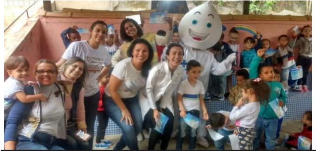
Saúde Bucal Na Escola Dr. Carlos Nabuco