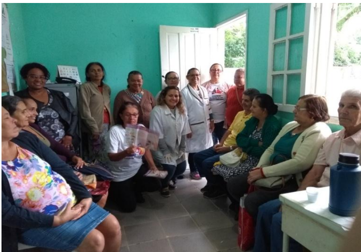
Palestra sobre Diabetes Mellitus (10.07.2018)