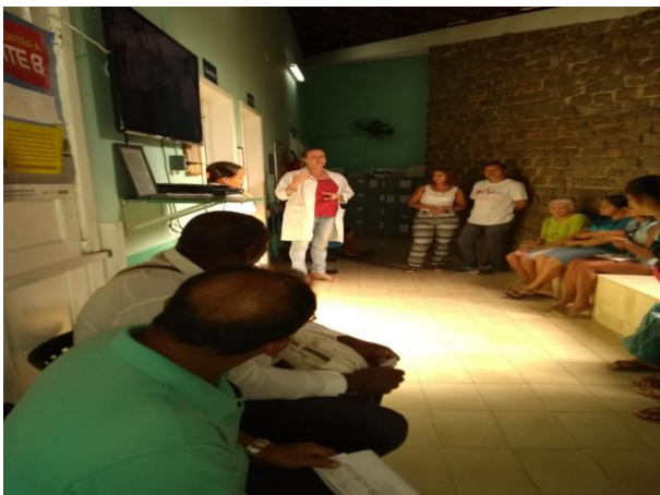
Palestra sobre Hipertensão e Diabetes (20.07.2018)