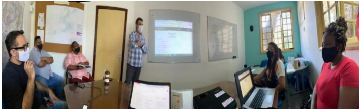
Reunião NIP – Fundo Municipal de Saúde (FMS) e Secretaria Municipal de Qualidade de Vida da Terceira Idade, em 16/04/2021