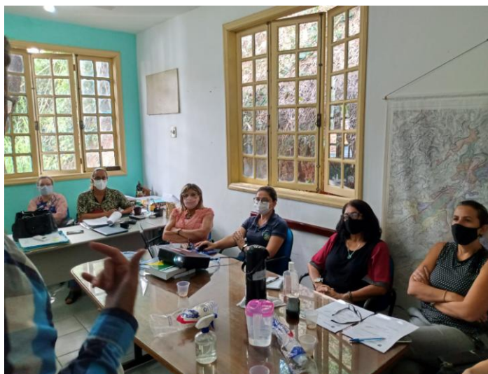
Reunião NIP – Secretaria Mun. de Meio Ambiente e Des. Sustentável e Secretaria Mun. de Agricultura e Des. Rural Sustentável, em 22/04/2021.