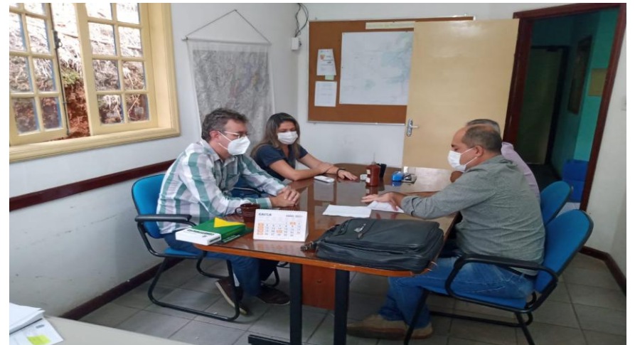
Reunião NIP – Secretaria Mun. Desenvolvimento Econômico, Indústria e Comércio, em 19/04/2021