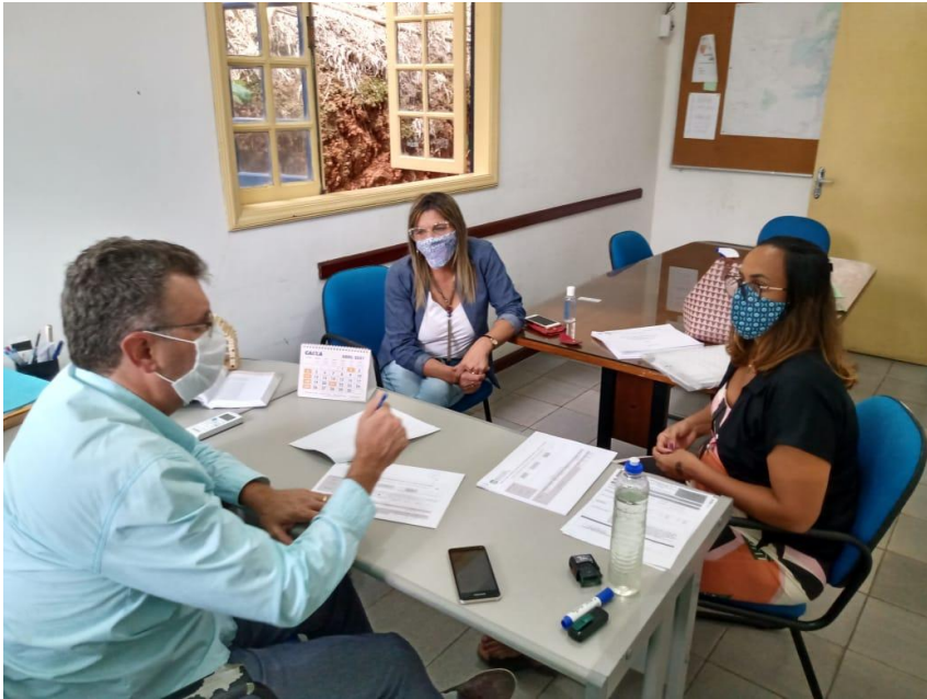
Reunião NIP – Secretaria Mun. de Meio Ambiente e Des. Sustentável, em 27/04/2021