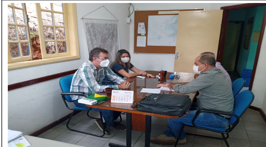
Reunião NIP – Secretaria Mun. Desenvolvimento Econômico, Indústria e Comércio, em 19/04/2021