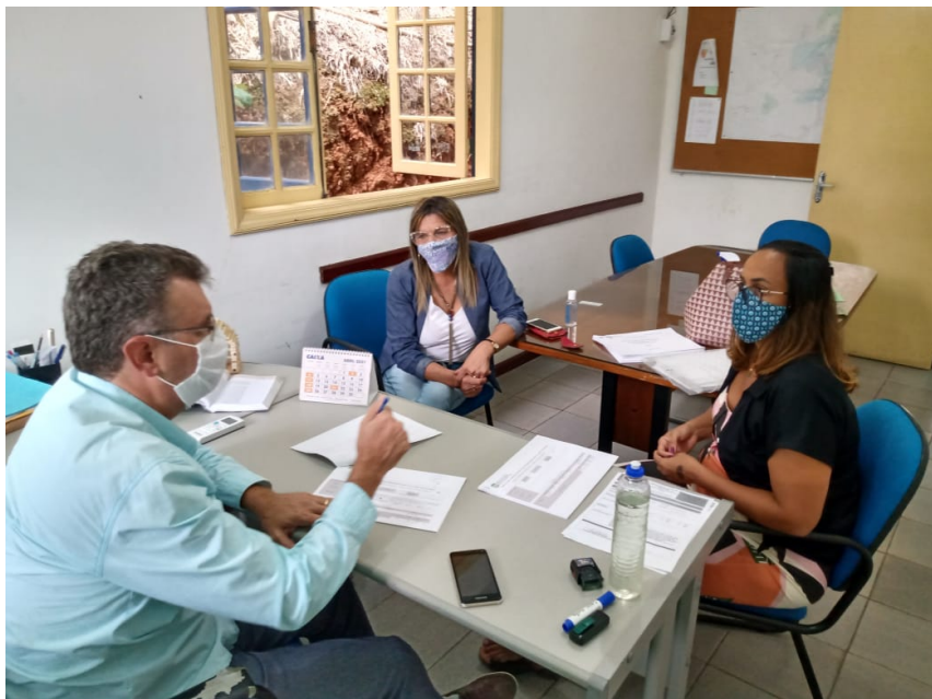
Reunião NIP – Secretaria Mun. de Meio Ambiente e Des. Sustentável, em 27/04/2021