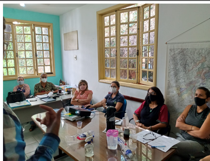
Reunião NIP – Secretaria Mun. de Meio Ambiente e Des. Sustentável e Secretaria Mun. de Agricultura e Des. Rural Sustentável, em 22/04/2021.