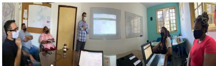
Reunião NIP – Fundo Municipal de Saúde (FMS) e Secretaria Municipal de Qualidade de Vida da Terceira Idade, em 16/04/2021